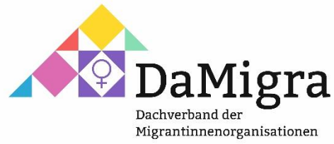
Dachverband der Migrantinnenorganisationen e.V.