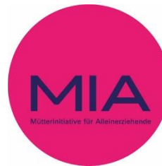
MIA - Mütterinitiative für Alleinerziehende e.V. i.G.