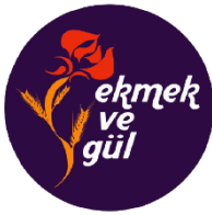
Ekmek ve Gül (Tirkiye)