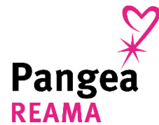
Pangea Reama (Îtalya)