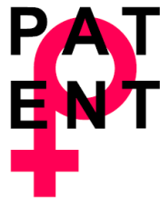
PATENT Association (Macarîstan)