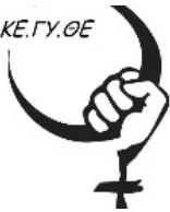
Research Centre of Women's Affairs (Yewnenîstan)