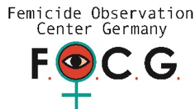
Femicide Observation Center (Almanya)